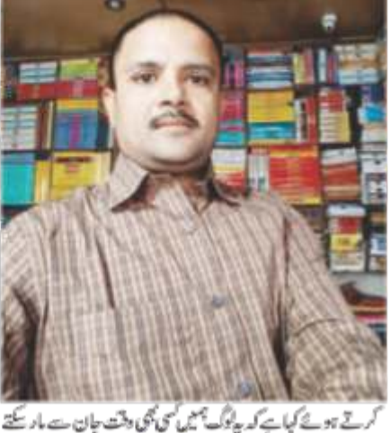
پانچ لاکھ کی رینگیاری کا مطالبہ

پانچ لاکھ کی رینگیاری کا مطالبہ کیا گیا۔ تاجر سے پانچ لاکھ کی رینگیاری کا مطالبہ کیا گیا۔ گولی مارنے کی دھمکی دی گئی۔