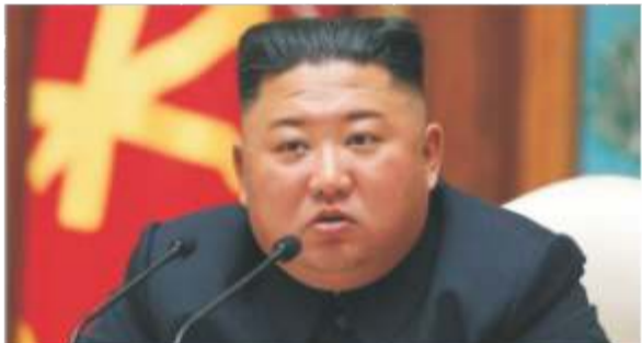
شمالی کوریا کے لیڈر کم جونگ ان کی سالگرہ پر عوامی حلف برداری کی تقریب

کم جونگ ان عظیم لیڈر۔ شمالی کوریا میں قائد کی سالگرہ پر عوامی حلف برداری۔ شمالی کوریا میں قائد کی سالگرہ پر عوامی حلف برداری۔ شمالی کوریا میں قائد کی سالگرہ پر عوامی حلف برداری۔