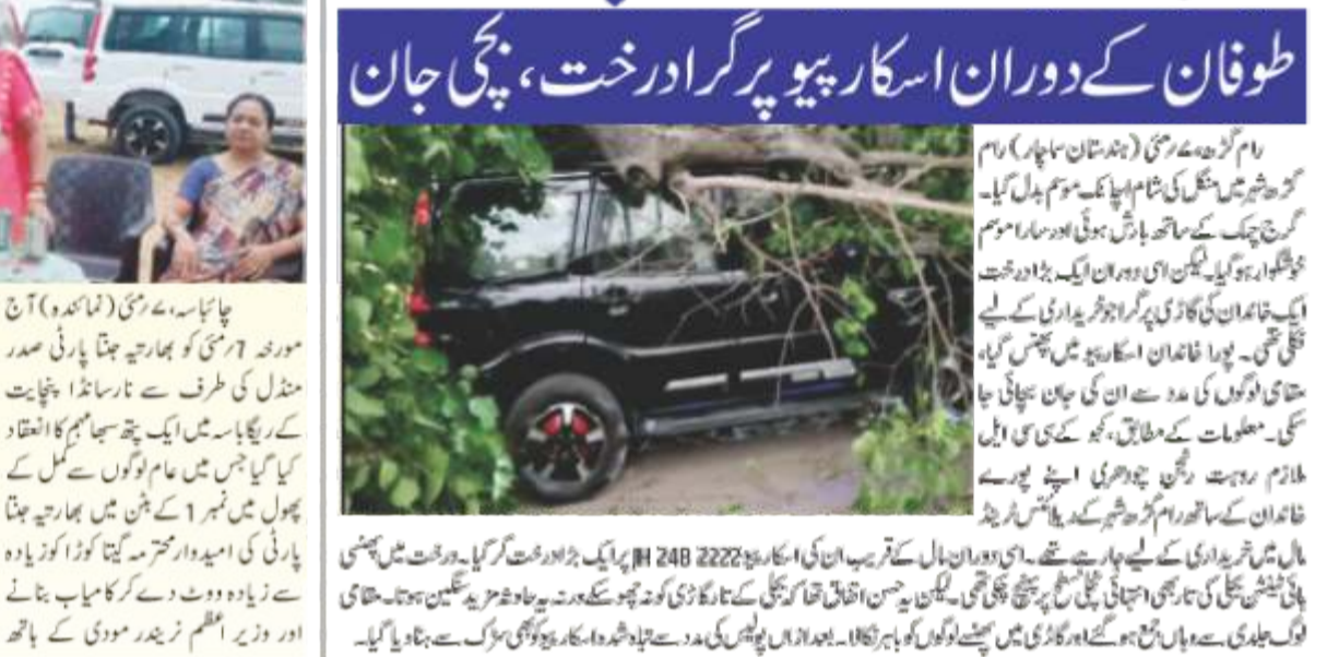
شاپنگ مال جاری تھی پوری فیملی طوفان کے دوران اسکا ریپو پر گرا درخت، بچی جان

شاپنگ مال جاری تھی پوری فیملی طوفان کے دوران اسکا ریپو پر گرا درخت، بچی جان۔ طوفان کے دوران ایک گاڑی پر درخت گرا گیا اور گاڑی میں بیٹھنے والے لوگوں کو خطرہ لاحق ہوا۔